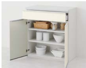
1段引出し付 開き扉