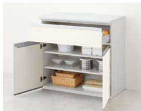
1段引出し付 開き扉