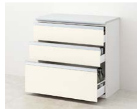
スライドストッカー 3段引出し