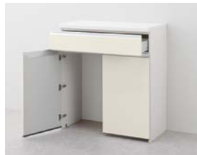
マルチスペース 扉付タイプ