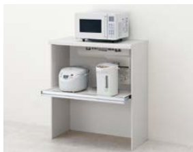
家電収納 オープンタイプ 送風式蒸気排出ユニット用