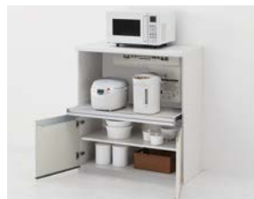
家電収納 開き扉タイプ 送風式蒸気排出ユニット用

○コンセントは蒸気排出ユニットに内蔵。 ○蒸気排出ユニットなしのタイプ(2口コンセント付 各々1,480Wまで)も選択できます。