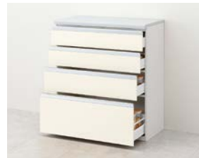
スライドストッカー 4段引出し