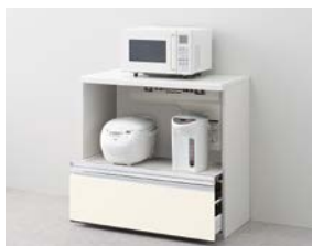
家電収納 下段引出しタイプ 送風式蒸気排出ユニット用